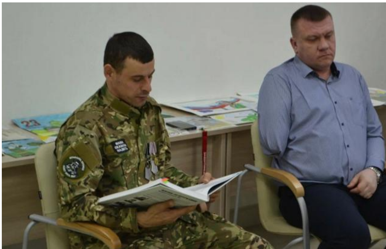
Подпись к фото, «Уроки мужества» вели и мобилизованные осенью 2022 года — те, кого демобилизовали из-за тяжелых ранений

«Уроки мужества» в российских школах появились еще во второй половине 2010-х годов. Они позволяли время от времени выступать перед детьми представителям любых силовых структур — от ветеранов МВД до сотрудников МЧС, которые рассказывали детям о предотвращении пожаров.