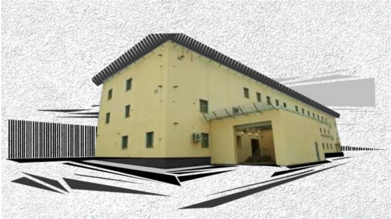
Подпись к фото, СИЗО-2 в Крыму

Последний крупный обмен военнопленными произошел 3 января этого года — в Украину вернулись шестеро гражданских. Это дает надежду родным пленных и правозащитникам узнать новую информацию об украинцах в российских тюрьмах.