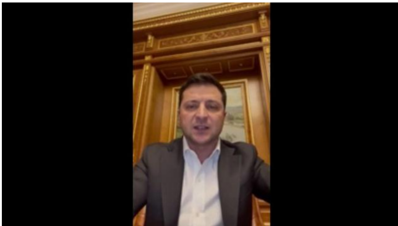
Автор фото, Скрин обращения президента Подпись к фото, Обращение Владимира Зеленского рано утром 24 февраля 2022 года

Присутствующие в Гостомеле еще не знали, что это последний раз президент Украины обращается к украинцам в костюме и белой рубашке: в этот же день он сменит официальный стиль на милитари.