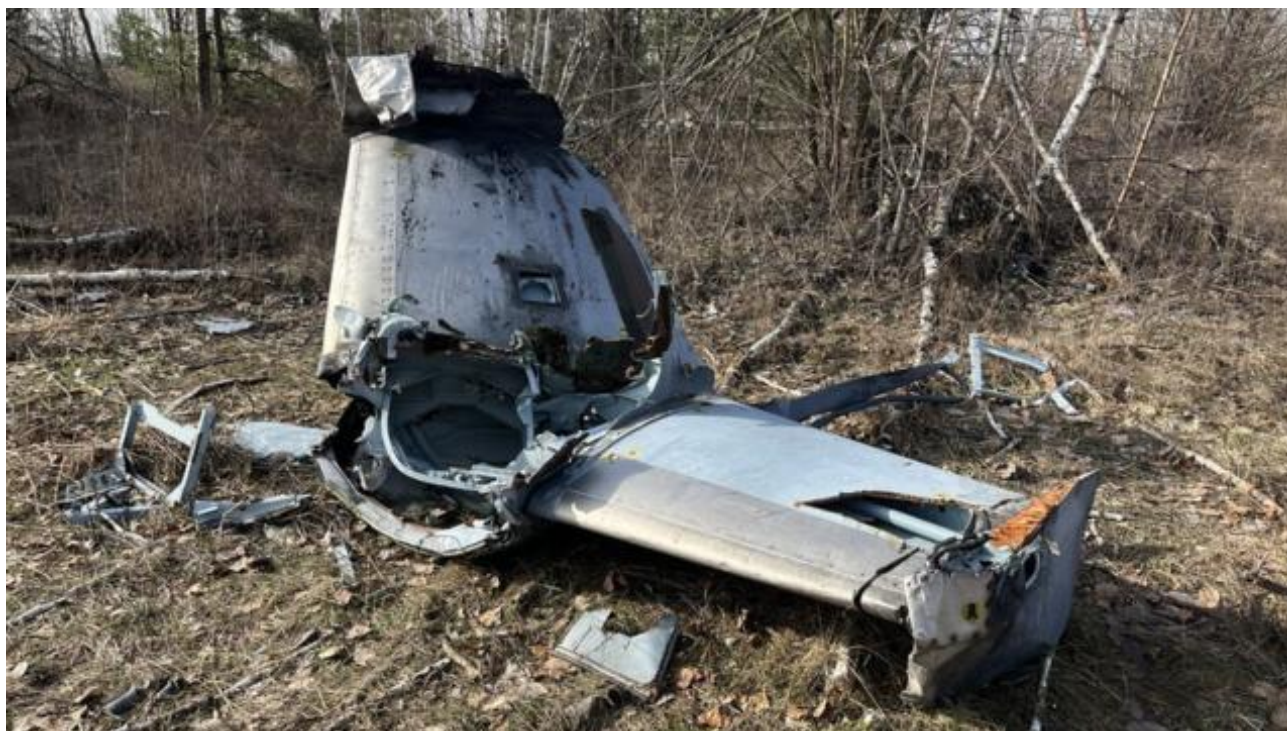
Подпись к фото, Обломки сбитого российского вертолета, которые до сих пор лежат возле Гостомельского аэродрома

После 11 утра, когда начались бои, находившиеся в Гостомеле безоружные пограничники перебежали в бомбоубежище. Оно было расположено в здании пищеблока на территории аэродрома. «Уже в бомбоубежище мы слышали звуки взрывов. Как раз в это время на Гостомель высаживался десант, по нему били нацгвардейцы», - рассказывает пограничник Сергей.